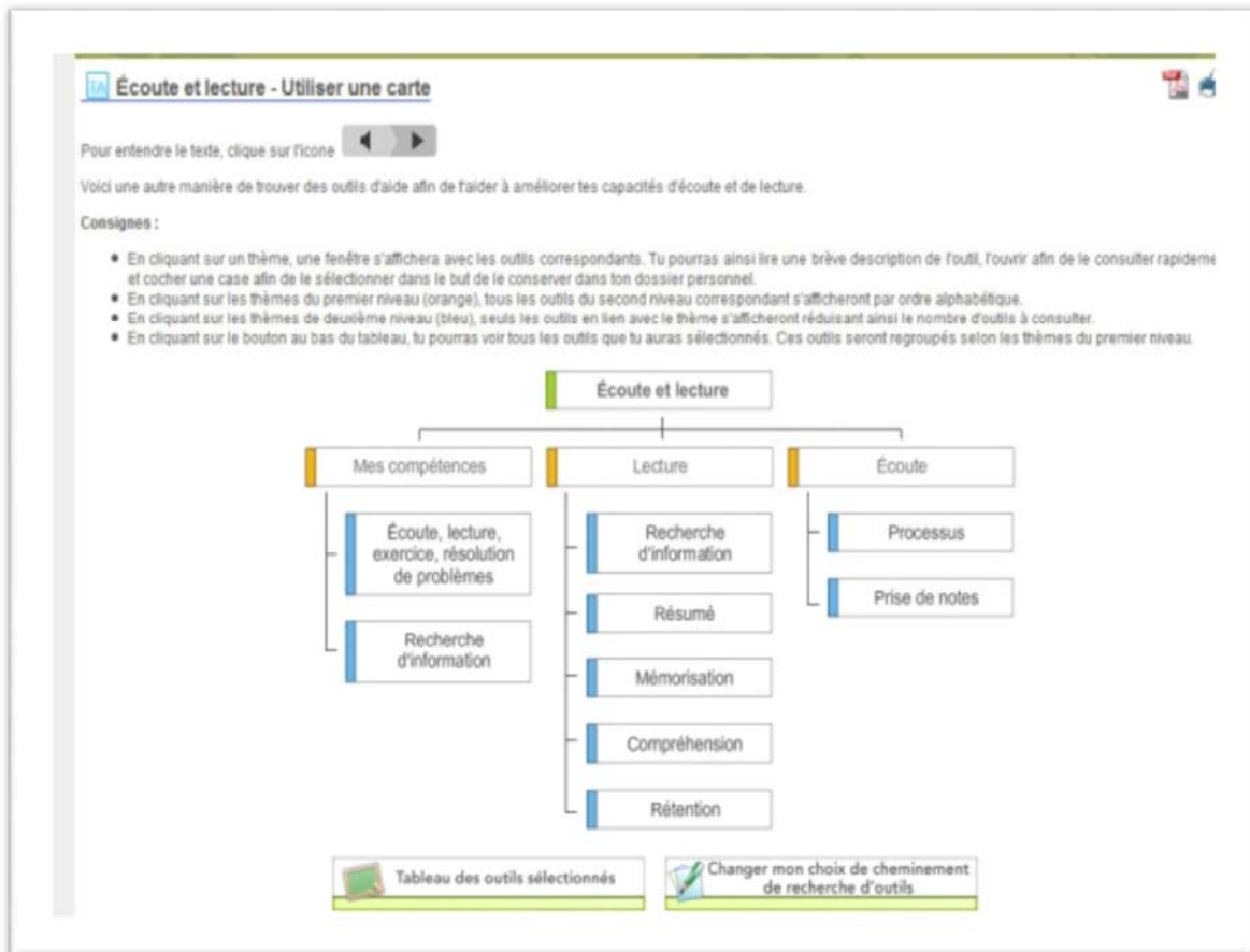
Figure 3. Recherche d'outils à l'aide d'une carte conceptuelle

Pour chaque catégorie de stratégies d'apprentissage et de mise à niveau des connaissances préalables, nous proposons aux étudiants trois façons d'accéder aux outils d'aide susceptibles de résoudre les difficultés qu'ils éprouvent : la recherche d'outils par mots clés, la recherche d'aide par l'utilisation d'une carte conceptuelle (Figure 3) ou la complétude d'une grille d'énoncés permettant de préciser les besoins en termes d'outils d'aide.