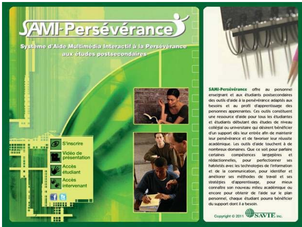
Figure 1. Page d'accueil de SAMI-Persévérance

• Le menu Accès étudiant constitue le cœur de SAMI-Persévérance. Cet environnement propose un lieu d'auto-apprentissage, d'autoréflexion et d'autoévaluation qui permet la personnalisation de l'apprentissage puisqu'il s'appuie sur l'analyse des difficultés propres à chaque étudiant afin d'offrir des outils d'aide adaptés.